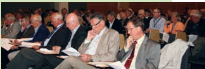
EIO:s årsmöte besöktes av ett 80-tal medlemmar, här begrundas valberedningens förslag.